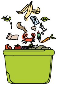
place scraps in your pail

1. Put your kitchen pail in a convenient location, like on your countertop, so you can easily collect food scraps and leftovers.