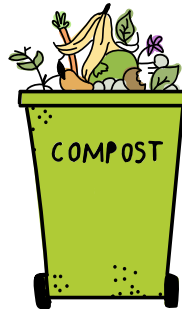
take your green cart to the curb